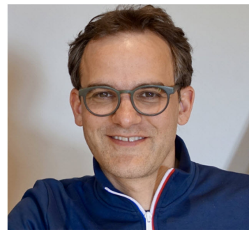
Ruedi Fanger Kommunikation

die Solidarität für Menschen in grosser Not appellieren. Wir würden uns freuen, wenn Sie CVT auch in für uns schwierigen Zeiten mit einer Spende unterstützen würden, um damit hochwertige Bildung und eine Zukunftsperspektive für junge Menschen in Myanmar zu ermöglichen. Herzlichen Dank!